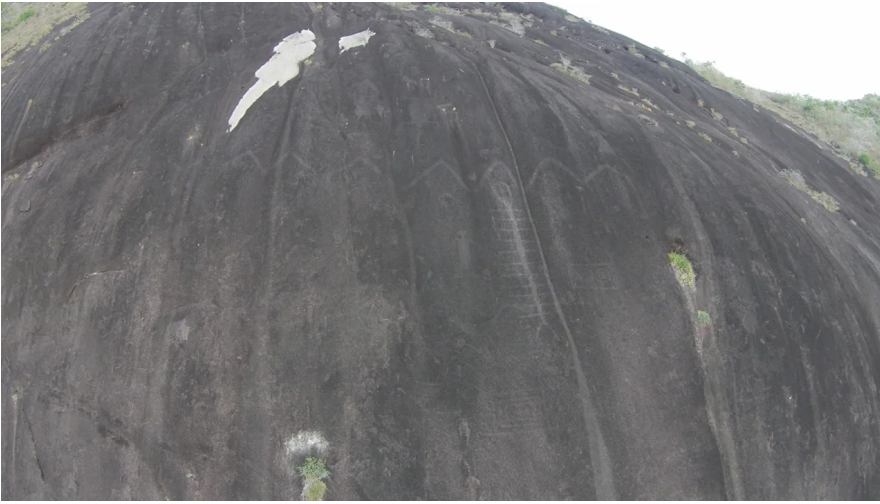
Cerro Pintado en Venezuela.